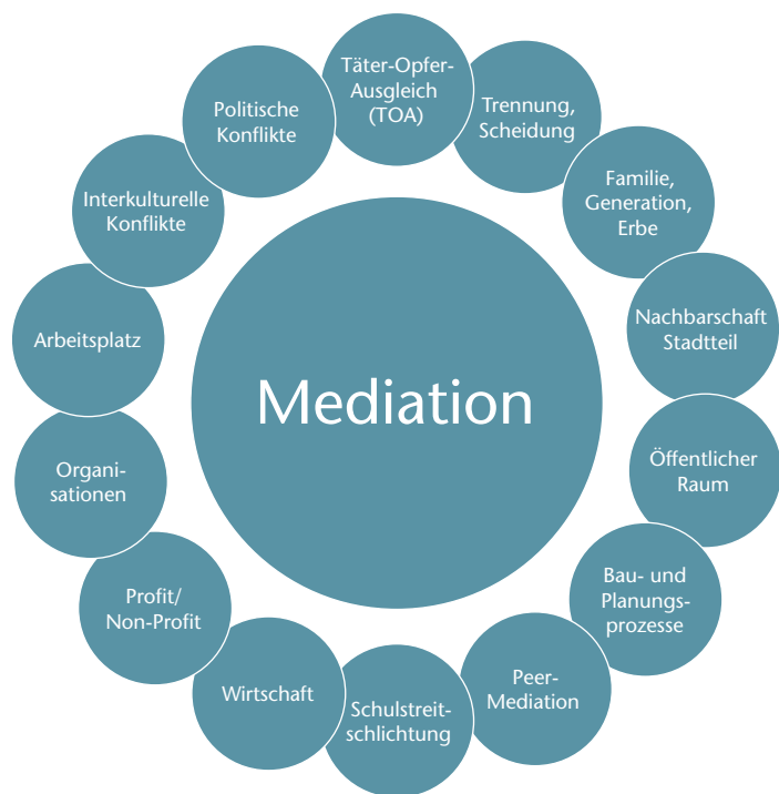
Abb. 3: Anwendungsbereiche der Mediation

Die Mediation findet in vielen sehr unterschiedlichen Anwendungskontexten ihren Einsatz (siehe Abb. 3). Im Anwendungsbereich Schule, Nachbarschaft, in interkulturellen Kontexten, im öffentlichen Raum und auch im strafrechtlichen Kontext (Täter-Opfer-Ausgleich) finden mit dem Verfahren der Mediation hilfreiche Interventionen für einen gelingenden Umgang mit Konflikten statt. Besonders verbreitet ist die Anwendung der Mediation im Zusammenhang familiärer Konflikte (Paare, Familie, Erbschaft, Trennung und Scheidung) sowie bei Konflikten im Bereich Arbeit und Wirtschaft (siehe auch den Beitrag von Beate Storner in dieser Ausgabe). In der Regel findet die Mediation hier als Intervention bei einem bereits eskalierten Konflikt statt. Neu etabliert sich in bestimmten Anwendungskontexten die Medi-