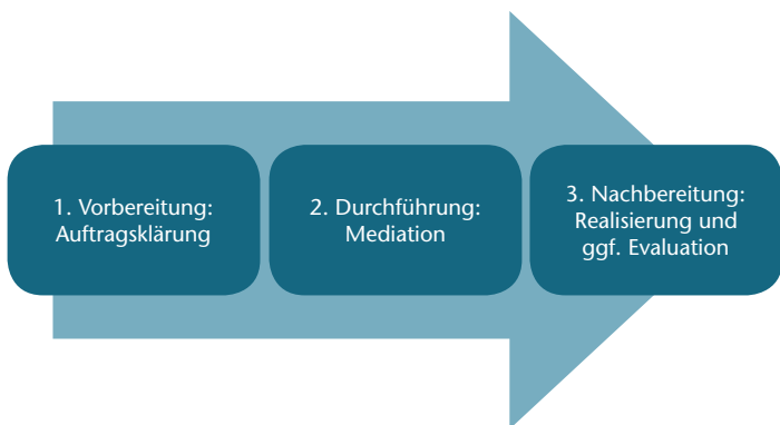
Abb. 1: Prozessschritte der Mediation (Frohn, 2013 a)

Grob betrachtet umfasst das Mediationsverfahren drei Prozessschritte (Frohn, 2013 a):